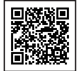
違反対象物公表制度