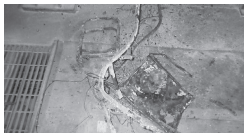
【燃え残ったパイプいす等】

家庭から出るごみの分別はもちろんのこと、事業者の皆様も、ごみの適正な分別に一層のご協力をお願いします。