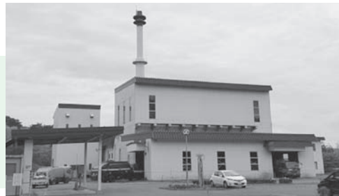
【久慈地区ごみ焼却場】