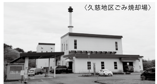
〈久慈地区ごみ焼却場〉

久慈地区ごみ焼却場は昭和61年に稼働を開始しましたが、老朽化が進んでいることから、平成30年11月頃から平成33年3月までの期間、ごみ焼却場の基幹設備改良工事を実施し、長寿命化を図る予定です。皆様のご理解とご協力をお願いします。