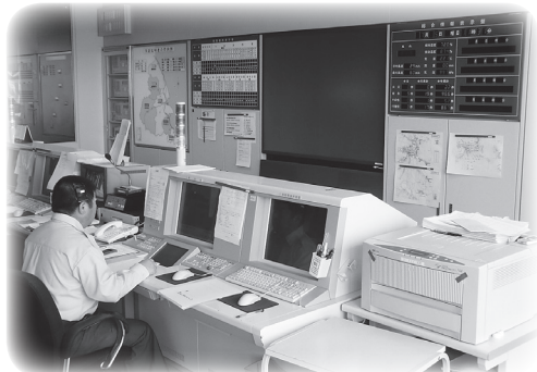
老朽化により整備される消防通信指令設備

一般会計及び介護保険特別会計をあわせた予算総額は、90億2,458万円で、そのうち一般会計予算は、平成25年度供用開始予定の新火葬場建設事業費（3億9,445万円）や老朽化した消防指令設備の更新工事（3億9,035万円）などを含む38億3,208万円を計上し、前年度比で9億5,916万円33.4%の増となりました。介護保険特別会計予算は、施設整備の進捗に伴う保険給付費の増額により51億9,250万円、前年度比で5億2,023万円11.1%の増となりました。