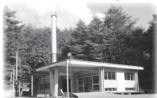
建設から40年が経過した火葬場